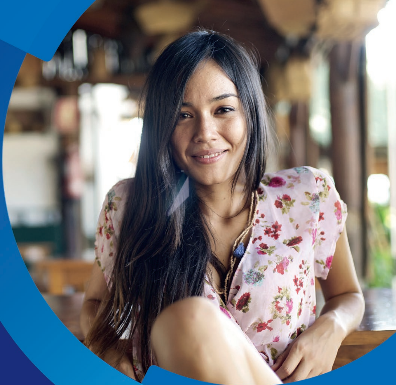
Tabela de Preços Bahia

Válida a partir de 14 de janeiro de 2019